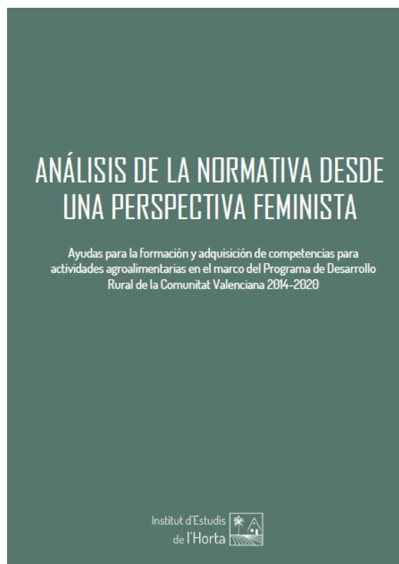
Ilustración 2. Imagen de la portada del análisis de las ayudas para la formación y adquisición de competencias para actividades agroalimentarias en el marco del PDR 2014-2020

Asimismo, desde la Asociación se ha participado en diferentes jornadas relacionadas con la igualdad, por ejemplo, se puede citar la participación en el Webinar “Análisis de las políticas y estrategias agroalimentarias desde una perspectiva feminista”, en el que se analizaron y comentaron diferentes políticas con diferentes mujeres de toda España de diferentes perfiles y organizaciones.