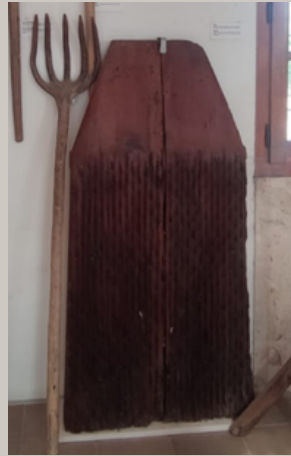
Museu de l'Horta del Ajuntament d'Almàspera