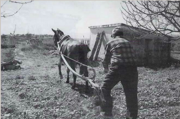
Fotografía de un forcat. Masos del Maestrat

También se utilizaba el aladre (forcat) , herramienta traccionada por un caballo, unida a unas piezas de hierro, denominadas rellas o cherugas , para arar la tierra mediante la apertura de surcos longitudinales.