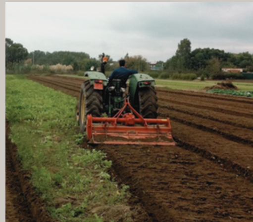
Fotografía de un agricultor con un rotovato