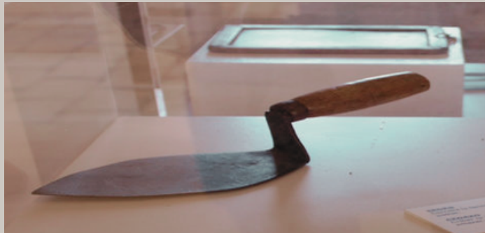
Museu de l'Horta del Ajuntament d'Almàspera

Debido a que la utilización de esta resultaba muy incómoda, esta herramienta ha dado paso a los sembradores manuales, que se accionan con un gatillo. Asimismo, también existen aperos para tractor que realizan esta tarea.