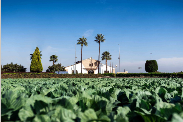
Fotografias del Museo de l'Horta de Almàssera