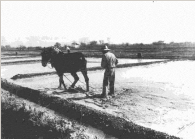
Fotografía del Museo del Montsia (Amposta)

Así, por ejemplo, la atabladora (o entauladora) , herramienta que se utilizaba para alisar y triturar la tierra de los campos, en sus orígenes, era una tabla de madera con clavos o cortantes, que traccionaba un caballo, y en la que se ponía de pie el agricultor. Actualmente, forma parte de un apero llamado rotovator.