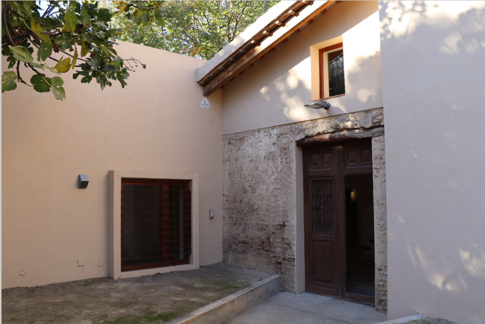
Fotografía de la Alquería de Félix

Actualmente, existen diferentes museos y espacios etnográficos en los que se pueden ver diferentes aperos y herramientas utilizados tradicionalmente en nuestra huerta.