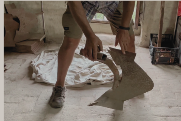
Fotografía de una rella o cheruga