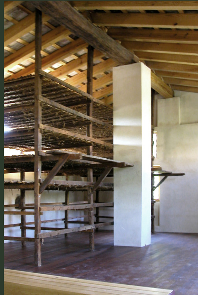
Fotografía de la sedera ubicada en la Alquería de Félix

Adicionalmente, durante muchos años, se pusieron cañizos en estos espacios para criar gusanos de seda para proveer de hilo a la industria sedera valenciana. Este sistema estuvo muy extendido y proporcionaba a las familias de los agricultores unos ingresos complementarios.